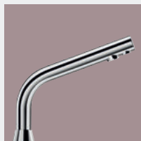
Torneiras para Locais Públicos