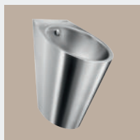
Sanitários em Aço Inoxidável