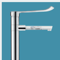
Torneiras para Estabelecimentos Hospitalares e de Cuidados de Saúde