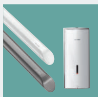
Acessibilidade e Autonomia Acessórios de Higiene